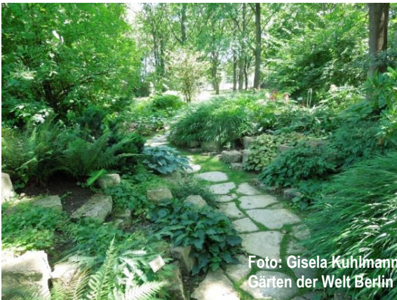
Gärten der Welt Berlin

Können Sie sich vorstellen in einem einzigen Raum zu wohnen?